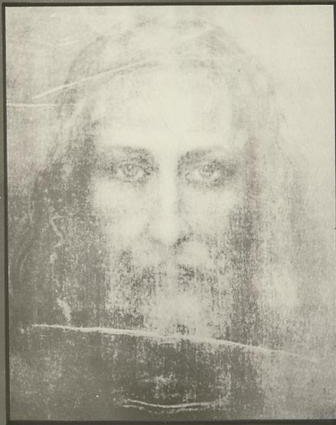
MONTAGE PHOTOGRAPHIQUE REALISE A PARTIR DU SUAIRE DE TURIN PAR C.LAVALLEE